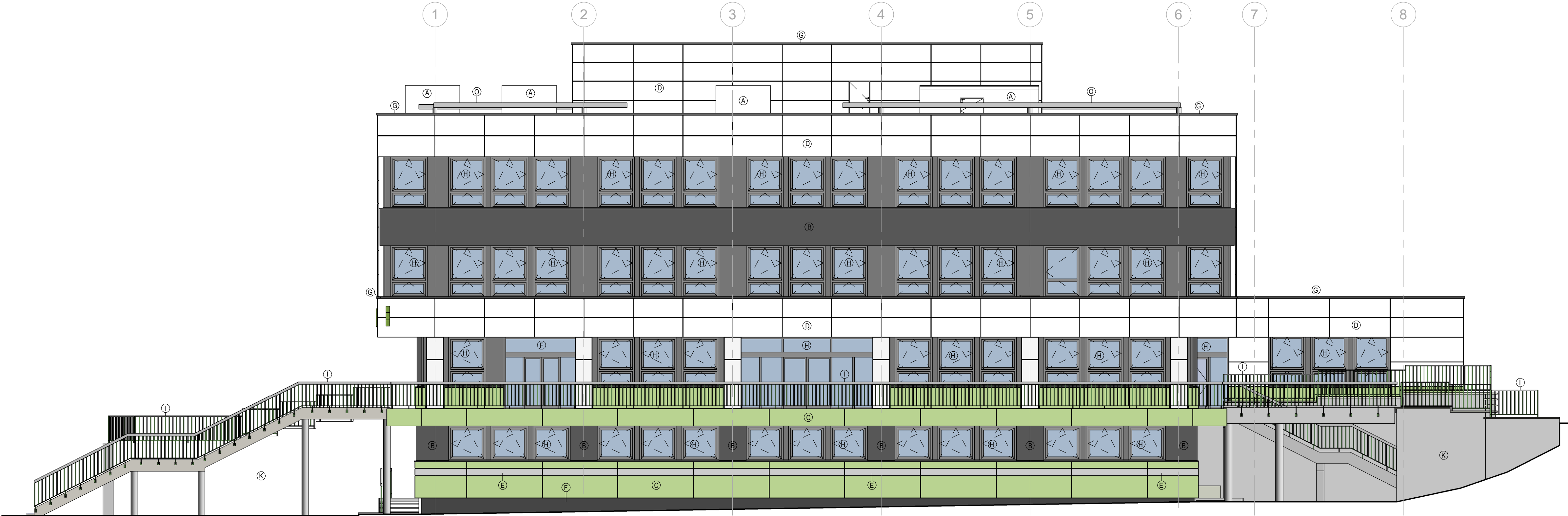
Pohľad južný – Nový stav